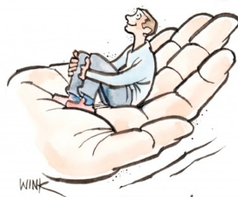
Getekend door: Willem de Vink

Onze eerste roeping is om van God te houden en een kind van Hem te zijn. Dat is een keuze: je bent vrij om 'ja' of 'nee' tegen Hem te zeggen. God houdt van jou en hoopt dat jij 'ja' zegt: ik wil Uw kind zijn!